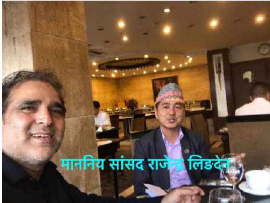
माननिय सांसद राजेन्द्र लिङ्देन